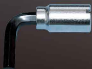
HCK ヘキサゴンヘッド